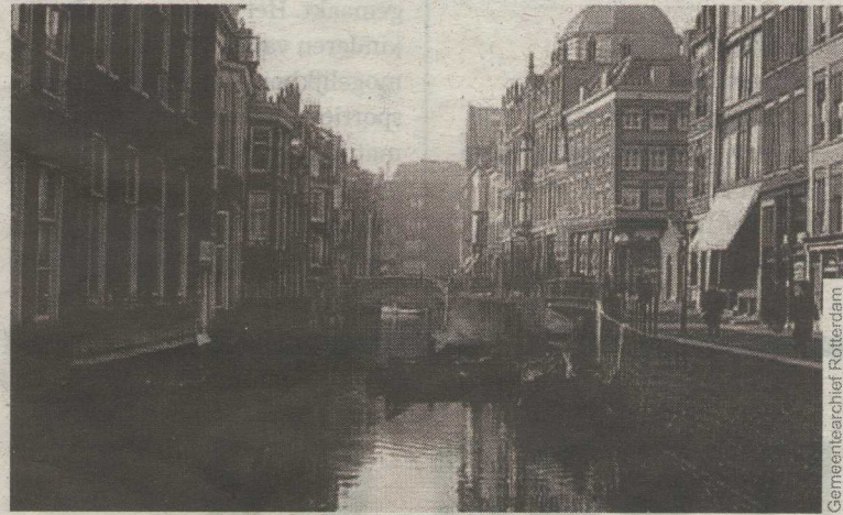
Zicht op het Steiger 1908.

In 1905 werd het gedeelte van het Steiger tussen het spoorwegviaduct en de Hoofdsteege gedempt. Dit gedempte gedeelte noemden ze Middensteiger. De Hoenderbrug kwam vervolgens te vervallen.